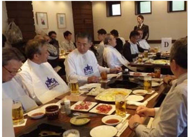
ボランティア活動後は皆でジンギスカン