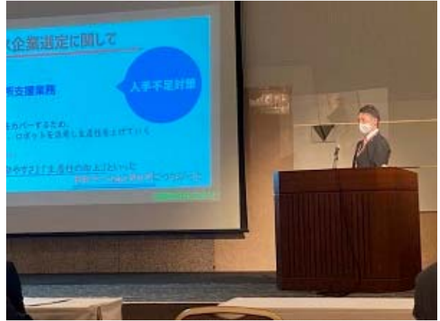
外部セミナーにおける当社健康経営の取組み、実施状況の発表