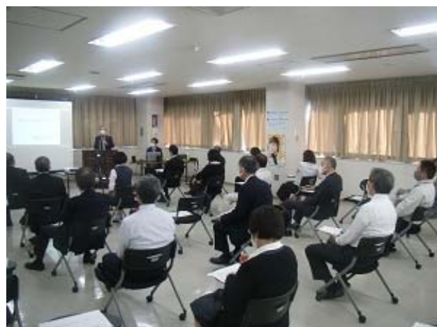
産業医による健康講話