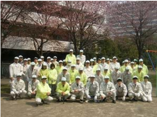
全職員による創立記念清掃活動