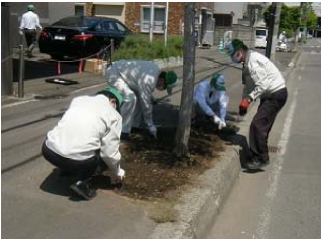
勇建設コミュニティーガーデン