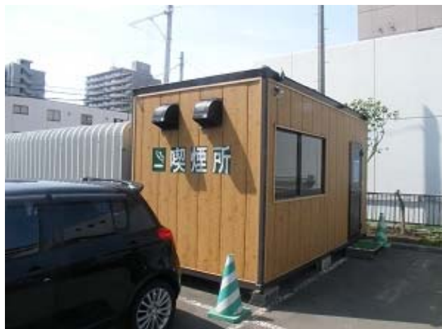
社屋外喫煙室の設置