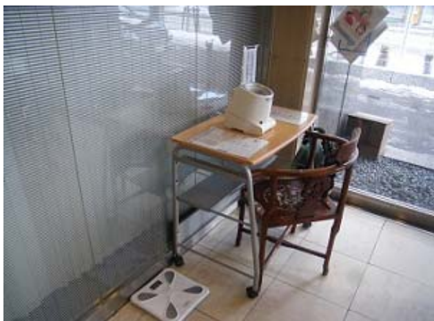
体重計、血圧計の設置